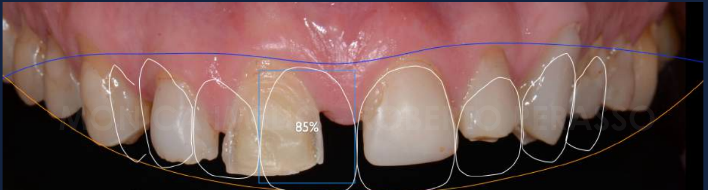
Comparison before and after interdisciplinary treatment